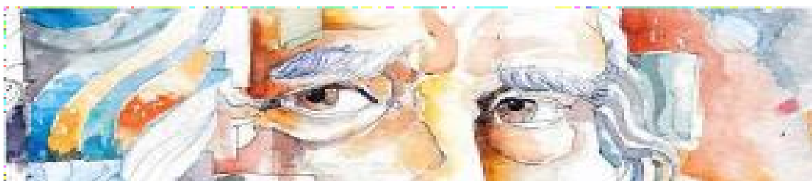
TABELLA N° 2

ISTITUTO OMNICOMPRESIVO "LEONARDO DA VINCI" ACQUAPENDENTE Via G.CARDUCCI s.n.c. 01021 Acquapendente (VT) CF 80019550567 – Tel..0763/734208 fax 0763/731491 e-mail VTIS01100L@ISTRUZIONE.IT ; PEC: VTIS01100L@pec.istruzione.it